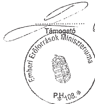
Dési Zsófia főosztályvezető

A Szerződés 6 oldalon és 2 db eredeti példányban készült. A Szerződéshez csatolt 7 db melléklet, és a Szerződéshez fizikai értelemben nem csatolt, de a Szerződésben vagy az ÁSZF-ben hivatkozott mellékletek, továbbá a támogatási kérelem adatlap és annak mellékletét képező valamennyi nyilatkozat, dokumentum a Szerződés elválaszthatatlan része.